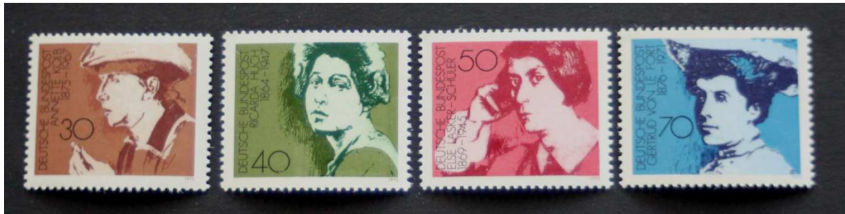
Annette Kolb (1870–1967), Schriftstellerin